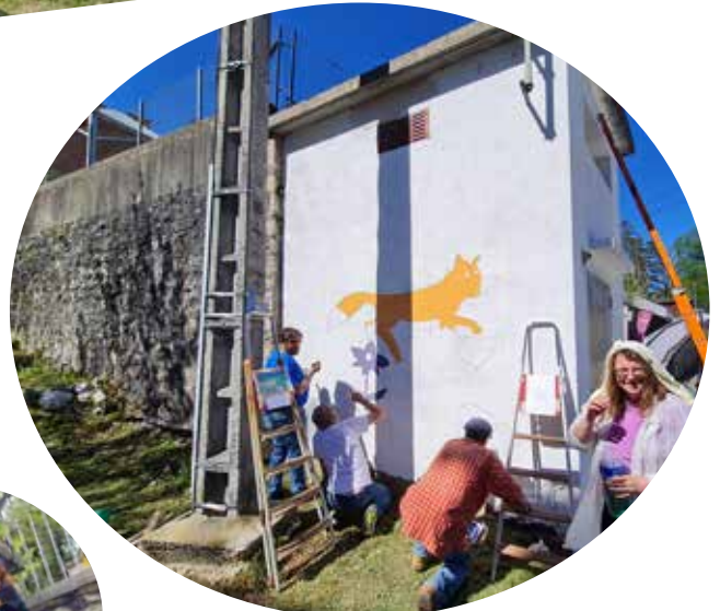
Le maître dirigeant ses troupes