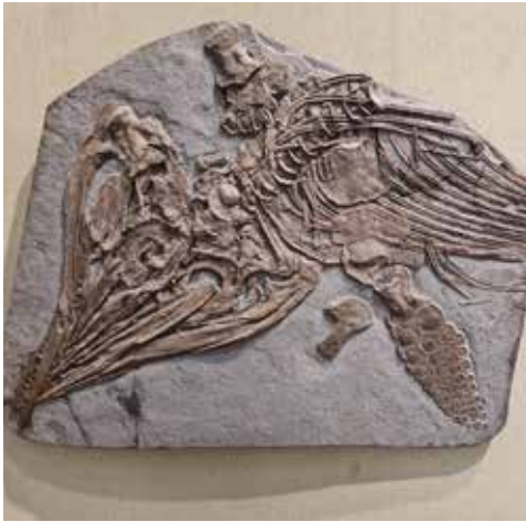
Fossile d'Ichtyosore à Jurassica Museum