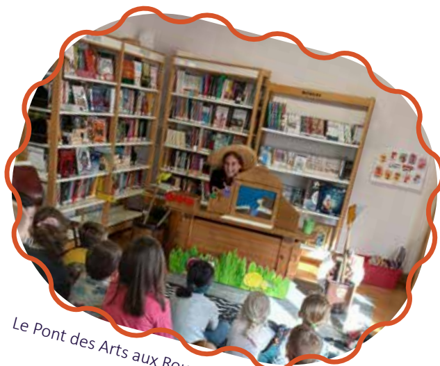
Le Pont des Arts aux Rousses le 26 mars