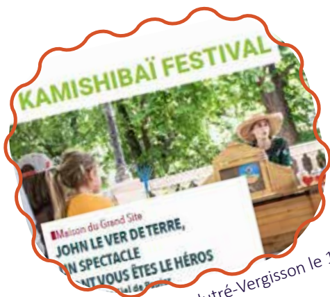
Kamishibai Festival à Solutré-Vergisson le 16 avril