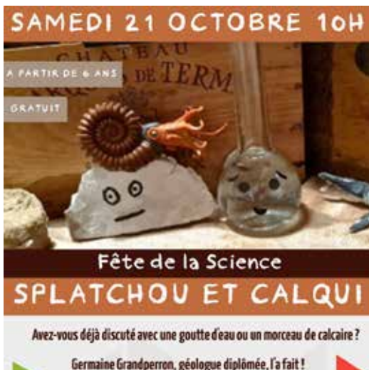
Splachou aurait-il changé de nom ? Affiche de la médiathèque de Saint-Amour