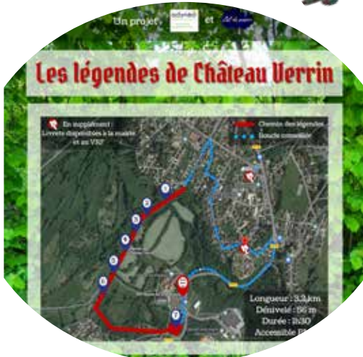
Panneau d'introduction de la balade