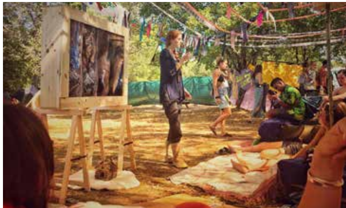
Optimistic Festival le 2 septembre