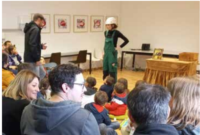
Journée de la science au Jurassica Museum à Porrentruy en Suisse le 13 mai