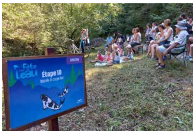
Fête de l'eau à Oyonnax, le 10 septembre