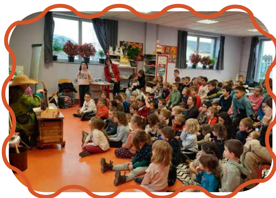
Champa'loisirs les 16 et 17 février