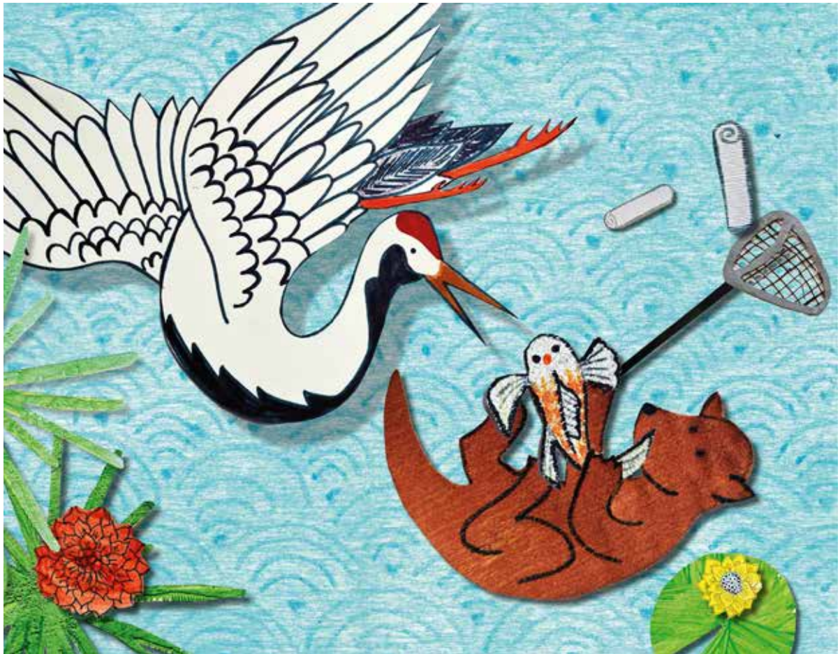
Planche du spectacle en kamishibai Nishiki, La carpe koi, création 2024, illustré par Christine Raffourt