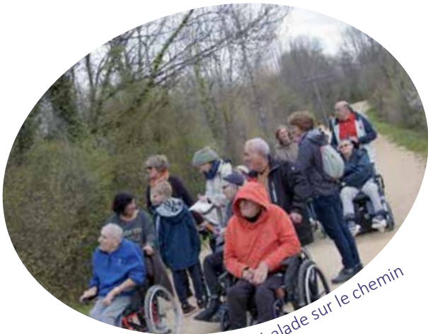
Première balade sur le chemin