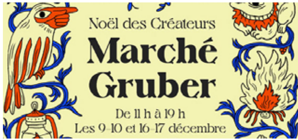
Sur l'affiche du Marché du Gruber à Strasbourg on peut apercevoir Ajyuuata, le feu