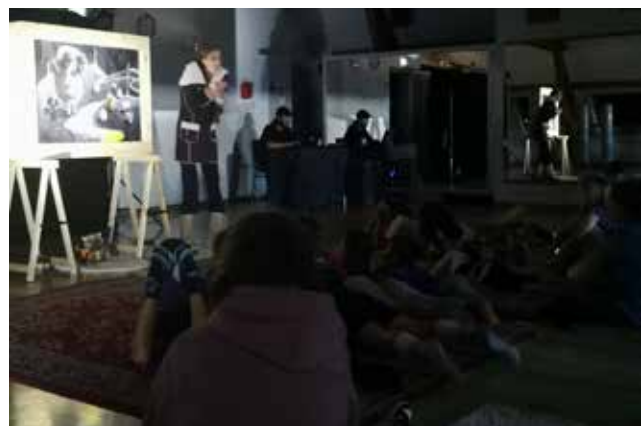
Première représentation avec le kamishibai géant à la Maison pour Tous MJC Longs Traits de Pontarlier Le 1er septembre