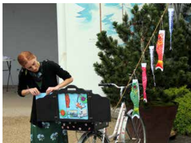
Représentation de Nishiki lors d'un mariage le 3 juin