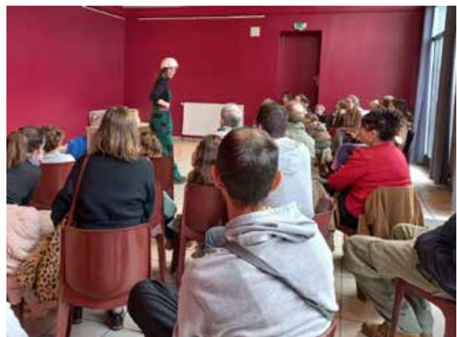
Représentation le 21 octobre à Saint-Amour