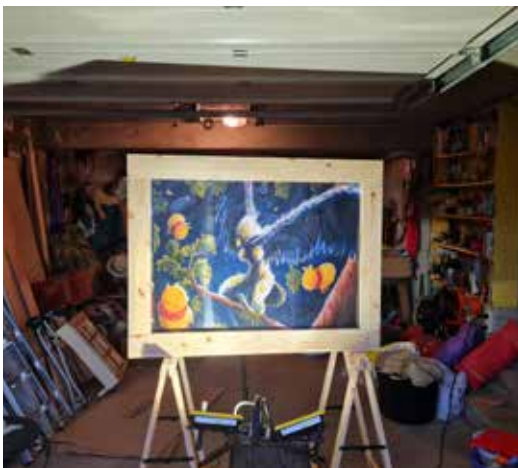
Fin août le kamishibai géant est prêt !