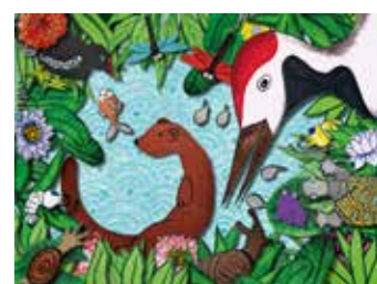
Les planches de Nishiki ont été dessinées par Christine Raffourt. Les différents éléments de l'histoire ont été assemblés par Anne-Flore de manière informatique.