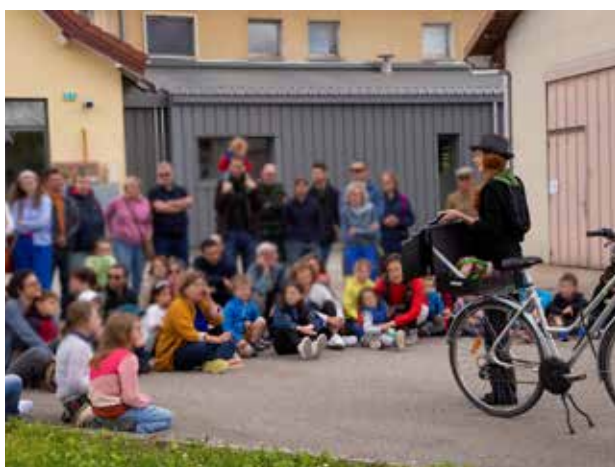
Première représentation de Nishiki à Japon en Grandvaux le 6 mai