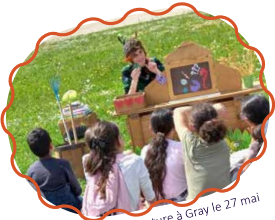
Fête de la nature à Gray le 27 mai