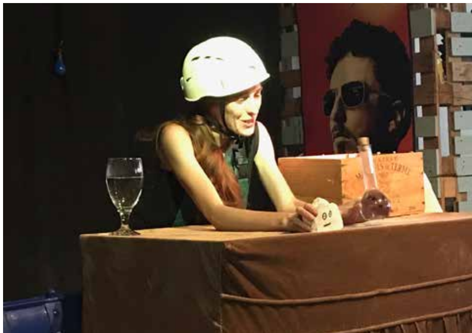
Friche en herbe le 29 juillet