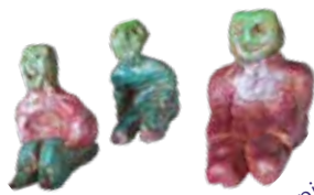
Les golems de pierre