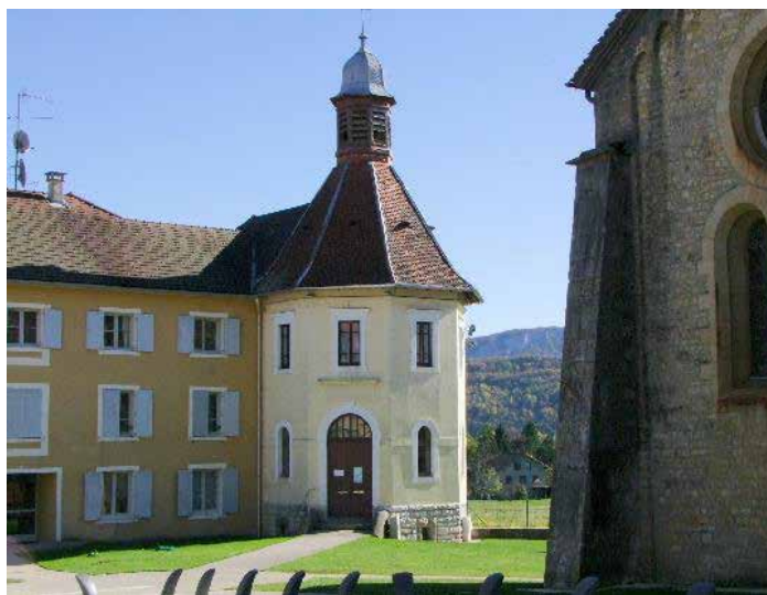
Ancienne mairie de Saint-Lupicin, lieu où se jouera le spectacle La Machine de Pandore