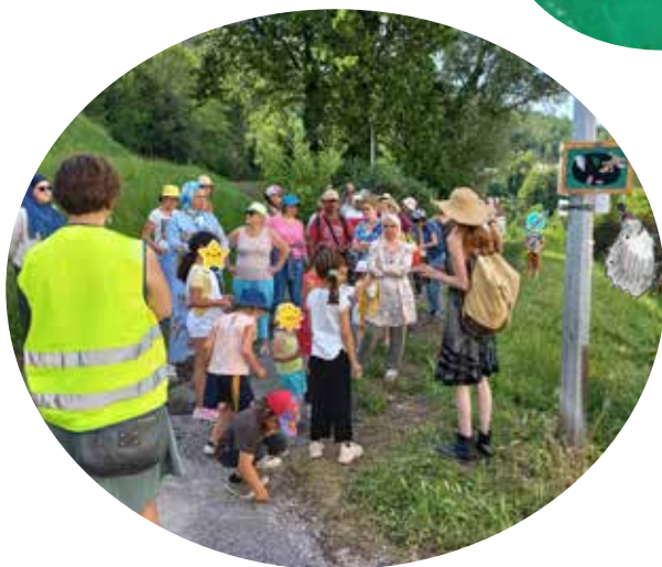
Restitution en balade