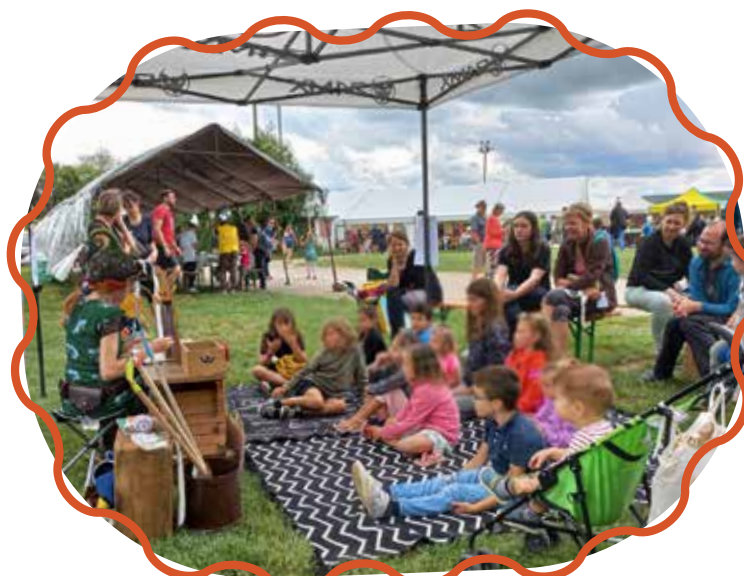
Festi'Mômes à Marnay le 27 août