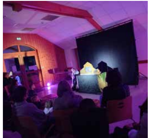
Châtel de Joux le 4 mars